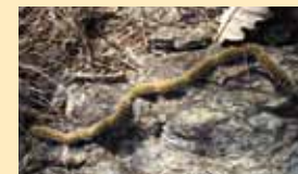
Figura 2: Bruchi in processione

per interrarsi nei luoghi più soleggiati e caldi fino a 20 cm di profondità: qui tessono un bozzolo entro il quale avviene la metamorfosi in farfalla. Si raccomanda di fare attenzione a non disturbare le processioni, poiché le larve presentano sul dorso dei micropeli urticanti di facile distacco a forma di arpione che, a contatto diretto o per dispersione nell'ambiente, possono provocare reazioni epidermiche e allergiche (soprattutto in soggetti particolarmente sensibili).