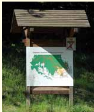
Bacheca del Parco

In questa guida ne vengono proposti alcuni: Percorso botanico , Percorso mountain bike ,