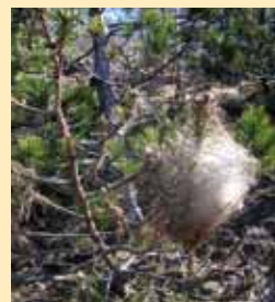
Figura 1: Nidi

Questo insetto, conosciuto in Piemonte come "gatta", appartiene all'ordine dei lepidotteri e rappresenta da sempre un problema sia a livello sanitario che vegetazionale per le aree che ne sono colpite.