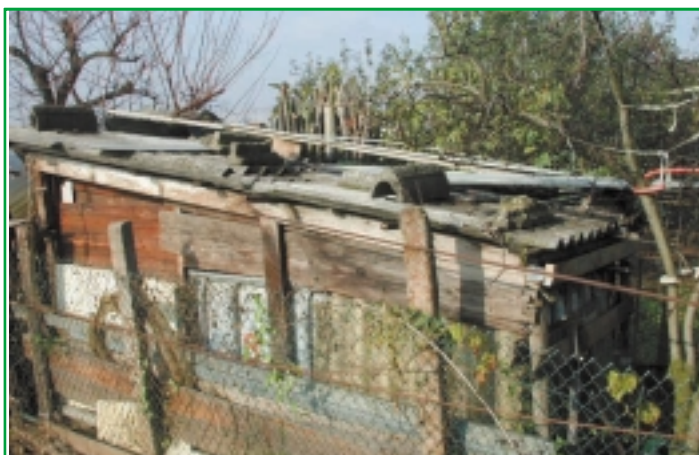
Una baracca abusiva prima dell'intervento G.E.V.

A seguito dell'ultimo grande fenomeno alluvionale dell'ottobre 2000, si sono verificate conseguenze disastrose nei Comuni di Nichelino e Moncalieri. Lì il torrente è costretto a scorrere tra sponde completamente cementate e con una sezione minore di quella a monte. La situazione è peggiorata per i molti materiali detenuti imprudentemente lungo le sponde che, trascinati a valle, hanno causato l'ulteriore restringimento della sezione.