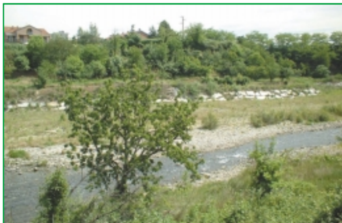
Le sponde del Sangone dopo l'opera di bonifica